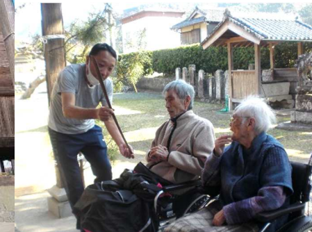
蔵貫の三島様に行きました。みなさん思い思いにお参りされていました。